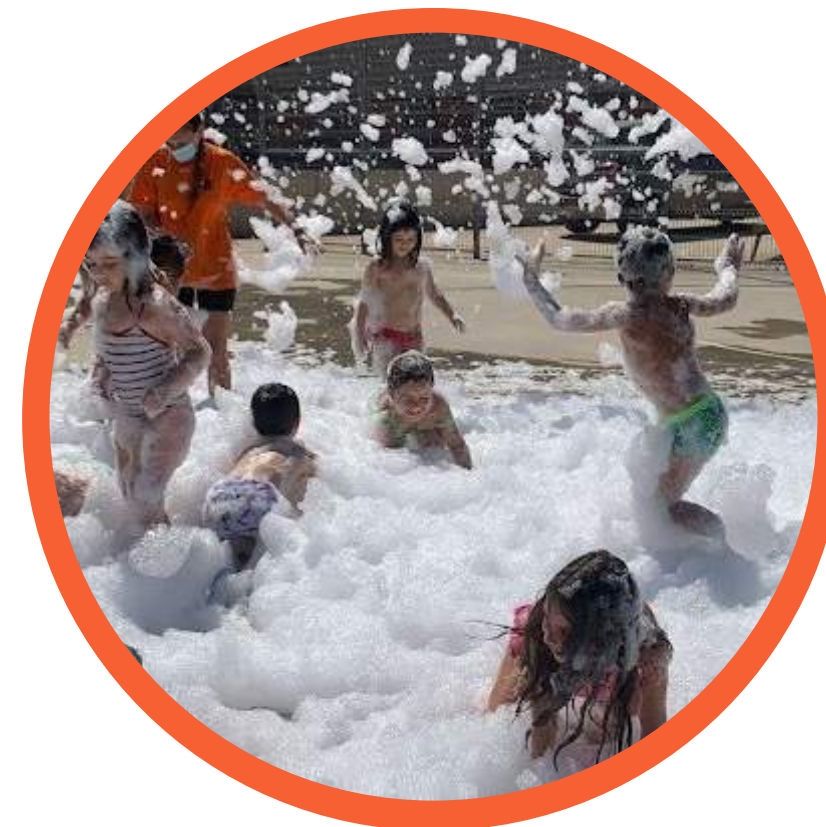
festa de l'escuma