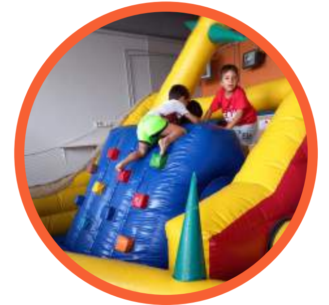
Inflable durant tot el casal