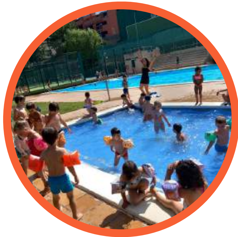
2 sortides a la piscina setmanals

Les sortides a la piscina i excursió al Tibidabo són opcionals. Tots els infants que no vulguin assistir es podran quedar al Casal amb normalitat.