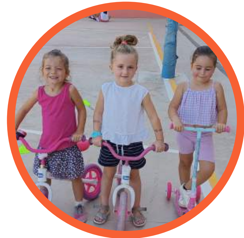
dia sobre rodes