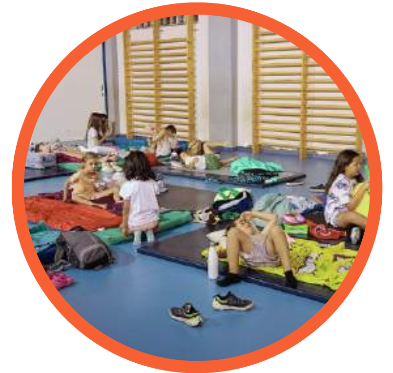
La Nit al Casal