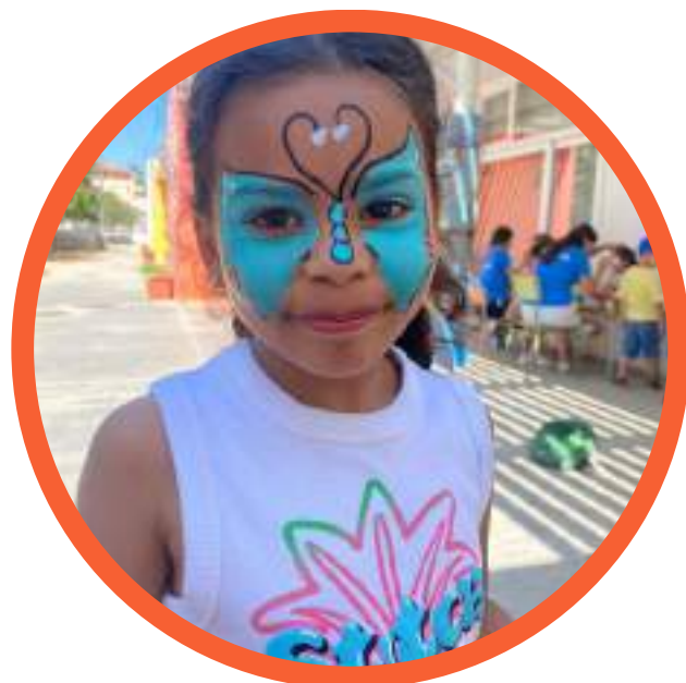
Taller de maquillatge