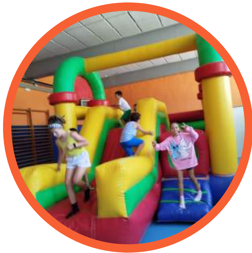
Inflables de terra

Durant el Casal treballarem i realitzem moltes activitats lúdiques, educatives i esportives. La gran majoria d'elles es realitzen dins l'espai escolar i d'altres sortim a la vora de l'escola o d'excursió. Aquí teniu un petit detall d'algunes activitats que realitzarem.