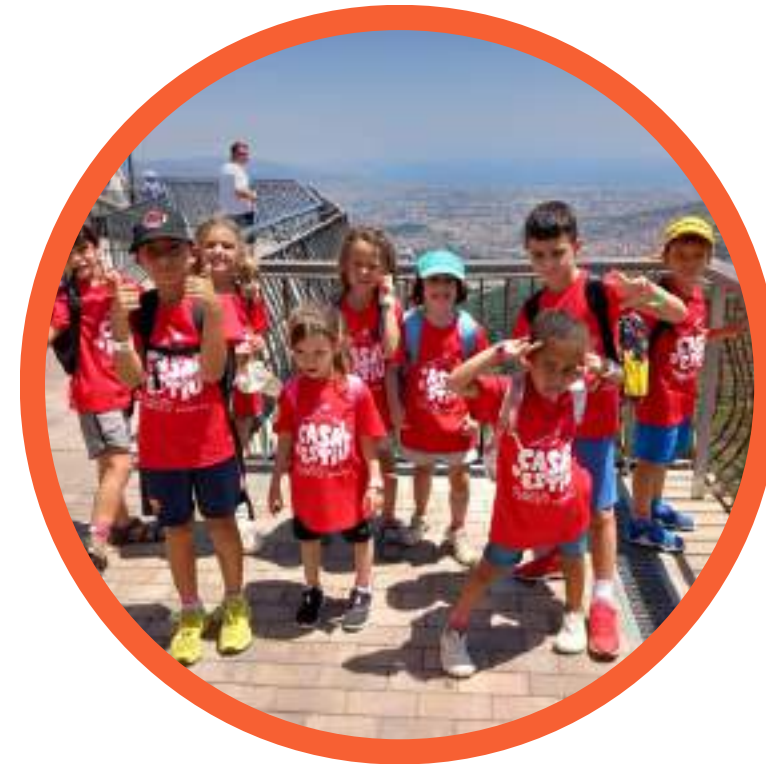
excursió de tot el dia al Tibidabo