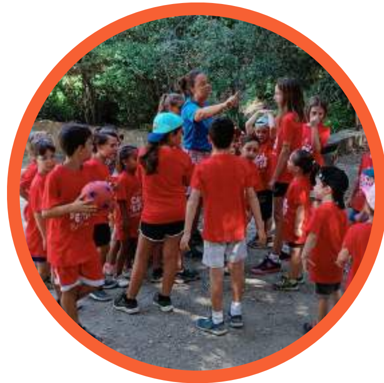
sortida per l'entorn