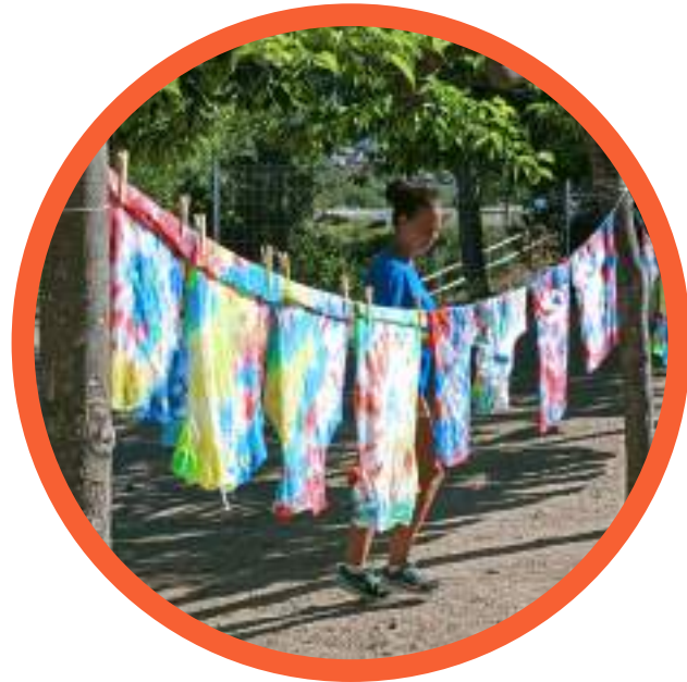
Taller de tenyir samarretes

Durant el Casal treballem i realitzem moltes activitats per grups o conjunts. Totes elles dintre l'aprenentatge educatiu i de valors que promovem des del Casal