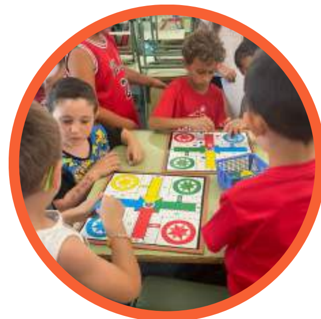
Jocs de taula